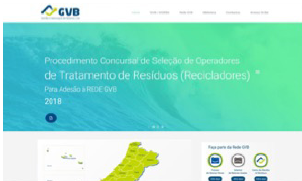
Figura 1 – Portal da GVB com a publicação do Procedimento Concursal para a Seleção de OTR

O procedimento foi constituído por um Caderno de Encargos com várias vertentes de avaliação, nomeadamente a vertente ambiental, técnica e económica.